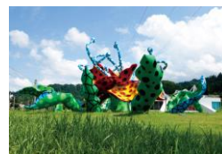
草間彌生 〈花咲ける妻有〉