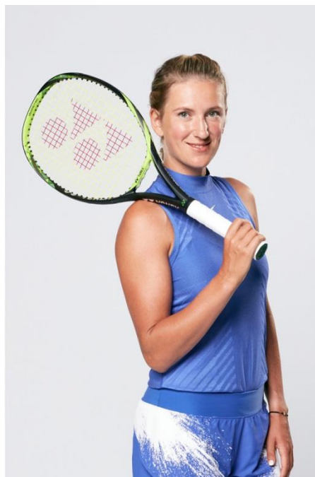
シリーズ最大のスイートエリアを達成した New『EZONE』と (左)、 ラケットを使用するグランドスラム2勝のビクトリア・アザレンカ (ベラルーシ)

ヨネックス株式会社 (代表取締役社長: 林田 草樹) は、四隅を広げたアイソメトリック形状でシリーズ最大のスイートエリアと、高弾性カーボン「HYPER-MG (ハイパーエムジー)」による高反発で、フレームトップ部でも威力あるショットを可能にするテニスラケット New『EZONE (イーゾーン)』シリーズを2017年9月上旬より発売いたします。