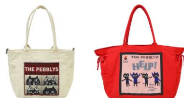
Me&Yoぬいぐるみケース キャッツフレンズ HELP! バッグ