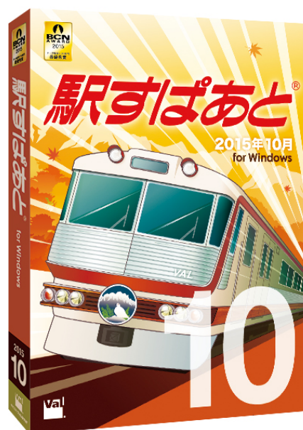
↑ パッケージイメージ

特設ページ： https://ekiworld.net/special/201510/