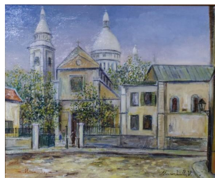
「サンピエール教会とモンマルトルのサクレクール寺院」

会期 2月16日(木)～22日(水) ※最終日は17時閉場 内容 1920年代を中心としたパリのモンマルトルやモンパルナスに、出身国も画風も様々な作家たちが集まり、「エコール・ド・パリ」と呼ばれました。フランス人の作家のほか日本人の作家も多く活躍し、後の世代の作家に大きな影響を与えました。今回は、個性豊かな作品、約40点を展示販売します。