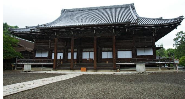
▲明智光秀ゆかりの西教寺