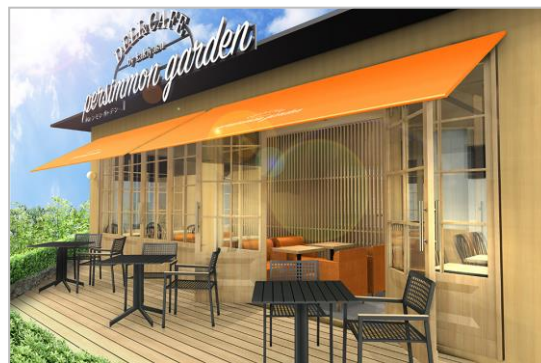
店内とテラスにあるイートインスペース