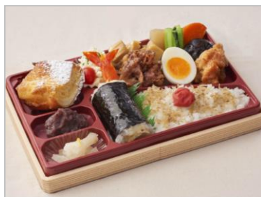
『ガーデン幕の内弁当』 (1個 税込1,080円)

牛肉しぐれ煮をはじめ、9種類のおむすびをご用意。ご飯は冷めてもおいしいと評される、島根県・奥出雲産の「仁多米」を使用。