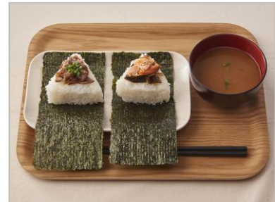
『おむすび』 (1個 税込130円～) ※味噌汁は別売り

自社工場「柿安スイーツファクトリー」で製造した北海道十勝産小豆を使用した餡をフレンチバケットでサンドした和洋折衷のデザートパン。