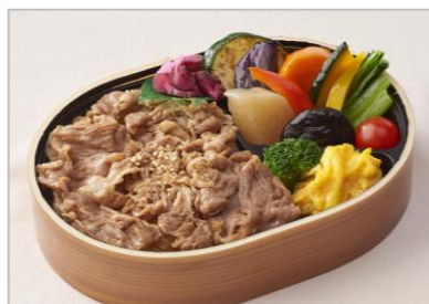
『黒豚 豚めしと10品目野菜の バランス弁当』 (1個 税込864円)

惣菜店「柿安ダイニング」のロングセラー『大海老マヨ』を使ったおむすび巻をはじめ、牛肉しぐれ煮や、和惣菜、フレンチバケットまで入ったボリューム満点のお弁当。