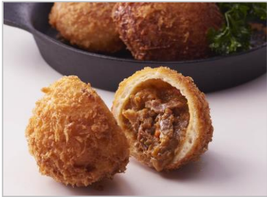
『柿安 牛しぐれカレーパン』 (1個 税込290円)

目玉商品の一つ。コクのあるカレールーに、たっぷりのタレで牛肉を炊いた看板商品「牛肉しぐれ煮」を入れた食べ応え抜群のカレーパン。