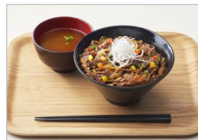
『牛しぐれ丼』 (1個 税込735円) ※イトインのみ提供

柿安のオリジナルブランド『プリンシャスポーク』を使用。甘めのタレでふんわり炊き上げた豚肉と一緒に緑黄色野菜がたっぷりに入った、バランスの良いお弁当。