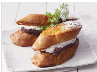
『フレンチバケットサンド (小倉あん&クリーム)』 (1個 税込346円)

目玉商品の一つ。コクのあるカレールーに、たっぷりのタレで牛肉を炊いた看板商品「牛肉しぐれ煮」を入れた食べ応え抜群のカレーパン。