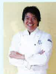
総合プロデュース 山下 春幸

ワイン(赤・白)・瓶ビール・スパークリングワイン 梅酒・ハイボール・ソフトドリンク各種