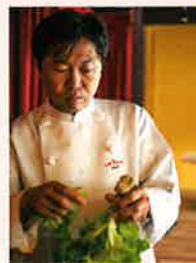
総合プロデュース 奥田 政行

リストランテ・スコラは世界の料理人1,000人に選ばれたアル・ケッチャーノの奥田政行シェフがプロデュース。淡路島の豊かな食の魅力を最大限に引き出したお料理を提供します。