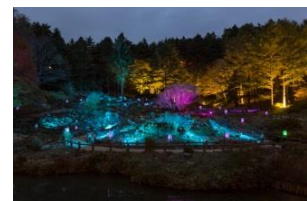
高橋匡太 《Glow with Night Garden Project in Rokko 提灯行列ランドスケープ》