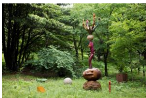
山本桂輔 《夢の山(眠る私)》

©Keisuke Yamamoto, Courtesy of Koyama Art Projects