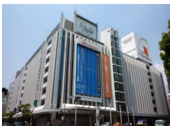
※東急百貨店本店の外観