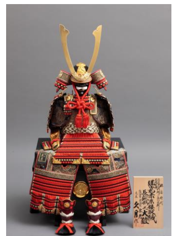
※出品商品の一例(＜久月＞甲冑)

https://www.ebay.com/usr/tokyu-department-store? trksid=p2047675.12559