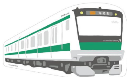
相鉄 12000系と JR 東日本 E233系