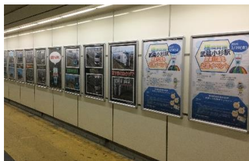
武蔵小杉駅 32連ポスターラック（イメージ）