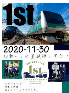
オリジナルポスター