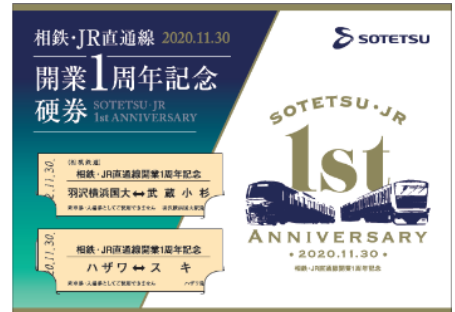
「相鉄・JR直通線開業1周年記念硬券」