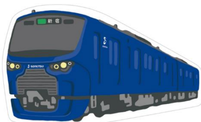
両面ポストカード（イメージ）