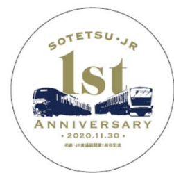
缶バッジデザイン