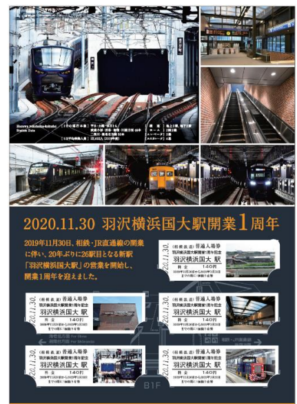
「羽沢横浜国大駅開業1周年記念入場券」