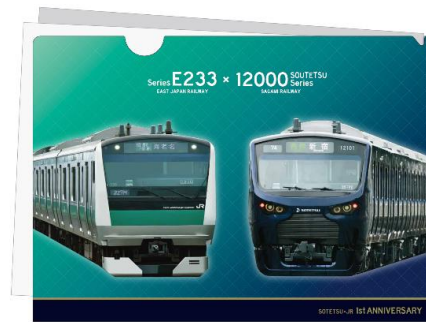
A4クリアファイル（イメージ）