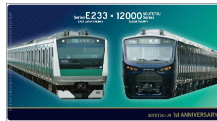
マスクケース（イメージ）