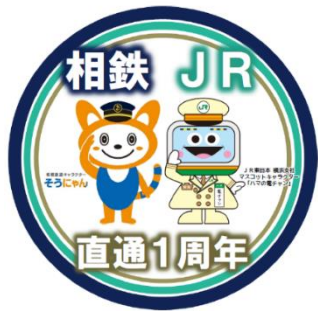
相鉄・JR直通線 開業1周年記念バッジデザイン