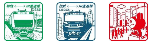
相鉄線3駅の各スタンプ（イメージ）