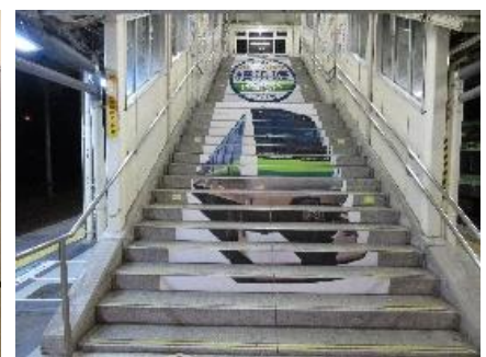
他駅での階段アート（イメージ）