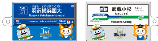
キーホルダー（オモテ面・ウラ面）