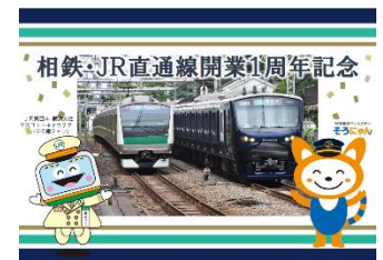
1周年記念オリジナルカード（イメージ）