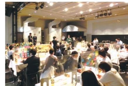
仙台まちづくり若者ラボ

地域課題の解決や地域特性を活かしたまちづくり、多様な主体が能力を発揮し地域づくりの担い手として活躍できる環境の整備、デジタル行政の推進などを通じて、都の個性を活かし、仙台らしい「まち」づくりを行います。