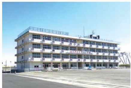
震災復興メモリアル事業(震災遺構仙台市立荒浜小学校)

SDGs 未来都市選定時のテーマでもある「防災環境都市」づくりを進めます。 震災の経験と教訓の継承、先端技術を活用した防災・減災の推進、産官学連携による防災関連産業、地域防災力の向上、脱炭素都市づくりやエネルギー自律型のまちづくり、グリーンインフラの推進などを行います。