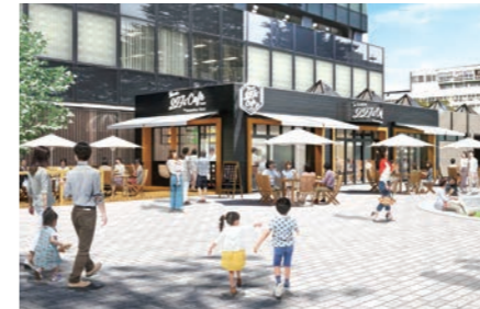
東北連携魅力発信拠点(イメージ図)

デジタルマーケティングの実践、東北の各自治体との連携、オンラインを掛け合わせた観光施策の実施などを通じて、新型コロナウイルス感染症による社会の変化に対応しながら、仙台や東北の魅力を発信することで、交流人口を拡大し、地域経済の活性化を図ります。