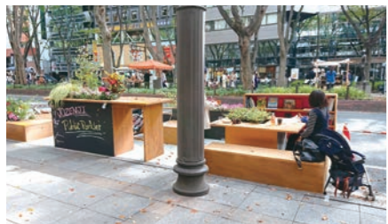
定禅寺通活性化社会実験

「都心再構築プロジェクト」を推進し、魅力的な都市空間づくりや都心の賑わい創出を進めるとともに、起業・創業への積極的な支援、地元企業の雇用確保や若者の地元定着策により、「ひと」を呼び込み、住み続けたいまちを目指します。