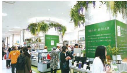
ローカルブランド「都の杜・仙台」販売支援

ローカルブランド「都の杜・仙台」による地域産品の発信力の強化、ECサイトを活用した域内外への販路開拓・商品拡大支援、地域経済を牽引する企業の創出に向けた支援、ICTなどの成長産業振興、産官学連携による近未来技術の実装促進など、仙台に「しごと」をつくる取り組みを進めます。