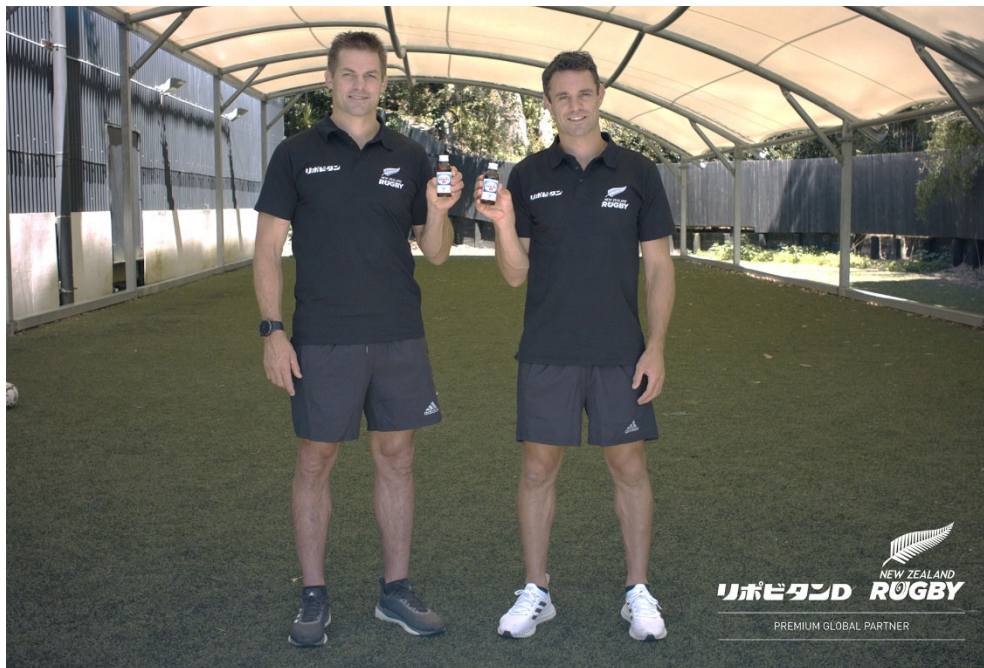
写真左：リッチー・マコウ氏、写真右：ダン・カーター氏

大正製薬株式会社〔本社：東京都豊島区 社長：上原 茂〕（以下、当社）は、元オールブラックスのリッチー・マコウ氏とダン・カーター氏と「リポビタンアンバサダー」契約を締結しました。契約期間は2022年4月1日～2024年3月31日までとなります。