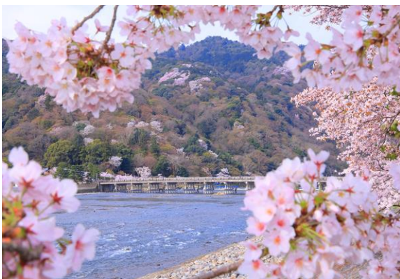
(嵐山 桜のイメージ)

※入場時には手の消毒や検温、混雑時には入場制限を設ける等、コロナウイルス感染症拡大防止策へのご協力をお願いします。