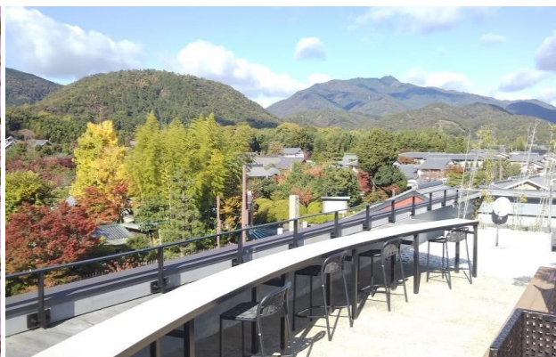
(嵐山駅ビル屋上の展望エリア)

「藤の花エリア」から駅ビル屋上へ上がると、展望エリアから嵐山の眺望をお楽しみいただくことができます。