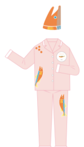
鮭ナイトキャップ、 鮭パジャマのイメージ

ベッドルームは、川を泳ぐ鮭を表現した空間です。川をイメージした青色の絨毯、鮭の切り身をデザインしたベッドカバーや、鮭のミニクッションなどが設えられています。今年は新たに、川で鮭を狙うクマをイメージしたパネルを壁に設置し、鮭ルーム専用の鮭ナイトキャップと鮭パジャマを加えます。このような空間で過ごすことで、まるで鮭になった感覚を楽しむことも鮭ルームの特徴のひとつです。