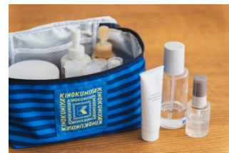
メイク用品も立ててしまえる 【1/2】