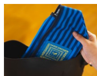
たためば超スリム