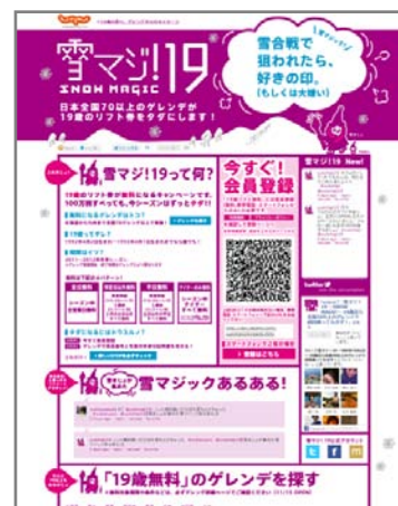
▲【公式サイト】「雪マジ！19～SNOW MAGIC～」