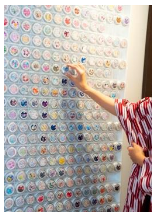
▲壁一面の365 HAND CREAM。柄はすべて大正時代の着物柄。