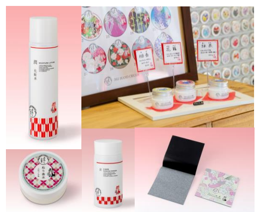
▲品質重視の豊富な商品展開。大正時代の女学生の袴姿をイメージした「矢筈(やがすり)」柄をデザインに取り入れている。