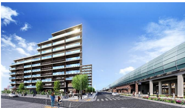
グレースィアウエリス横浜ゆめが丘 外観 (イメージ)