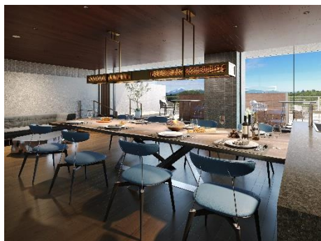
フジビューラウンジ (イメージ)