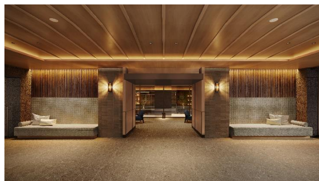
エントランスホール (イメージ)