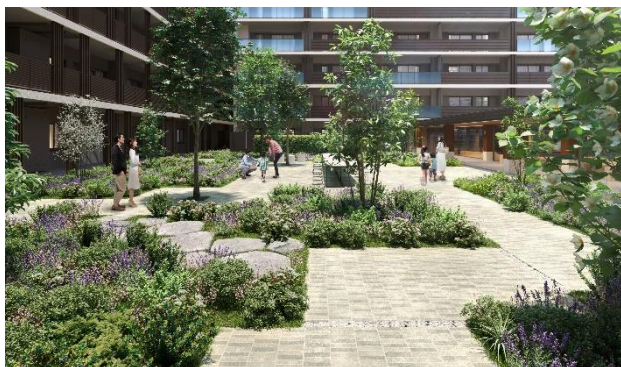
プライベートガーデン (イメージ)