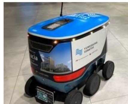
ソラトスの自動配送ロボット