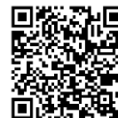
「グレースシアウエリス横浜ゆめが丘」 ウェブサイト