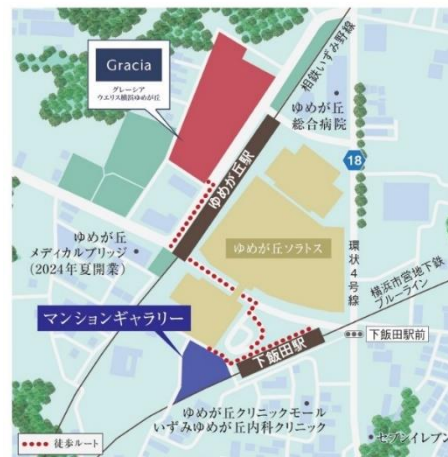
「グレースシアウエリス横浜ゆめが丘」 位置図