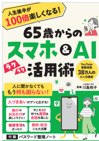
『65 歳からのスマホ&AI 活用術』

株式会社オレンジページ（東京都港区）は、初心者・シニア向けにスマホやパソコンの使い方を解説する、登録者数 38 万人超の YouTube チャンネル「いなくTV」でおなじみの川島玲子監修による『65 歳からのスマホ&AI 活用術』を 12 月 9 日（火）に発売します。行政手続きやキャッシュレス決済など社会のデジタル化は急速に進む一方、「スマートフォンは難しい」「AIなんて自分には縁遠い」と感じるシニア層は少なくありません。本書は、こうした 65 歳以上の方のスマートフォンへの苦手意識を払拭し、人生後半をもっと自由に、自分らしく過ごすための「スマホ&AI」の活用術をわかりやすく解説しています。