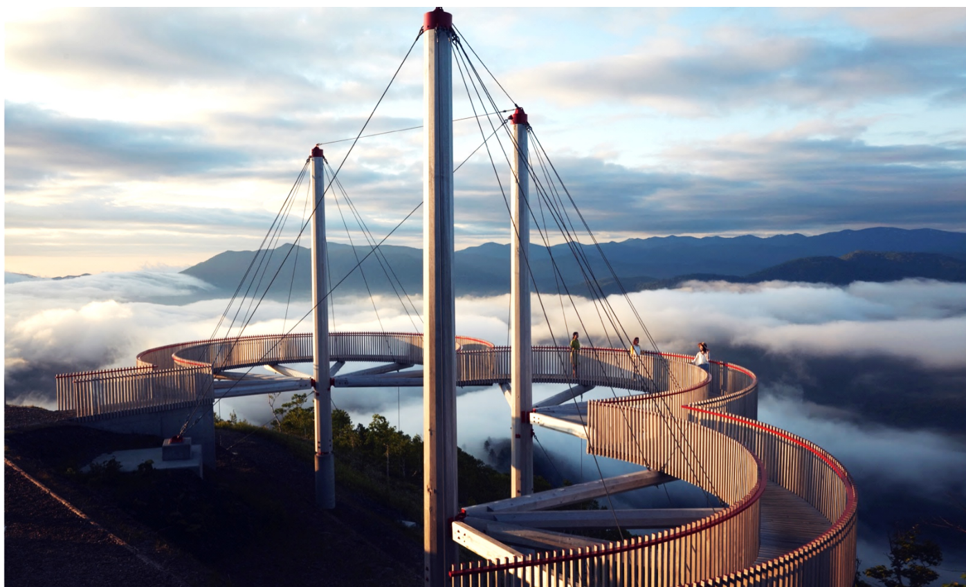
Cloud Walk (クラウドウォーク)

北海道最大級の滞在型リゾート「星野リゾート トمام」が提供する宿泊プラン「雲ガールステイ」に、「雲海テラス貸切り遠足」が新たに登場します。雲海テラス貸切り遠足は、一日一組限定で日中に雲海テラスを貸切りにでき、各展望スポットで思い思いの時間を過ごせるプログラムです。また、雲をモチーフにした「雲おにぎり」や、雲海テラスでの遠足を思い切り楽しめるグッズを用意しています。2019年6月1日～10月12日に利用できる宿泊プラン「雲ガールステイ」に申し込んだ方限定の、唯一無二の体験です。