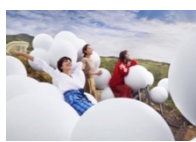
Cloud Bed (クラウドベッド)