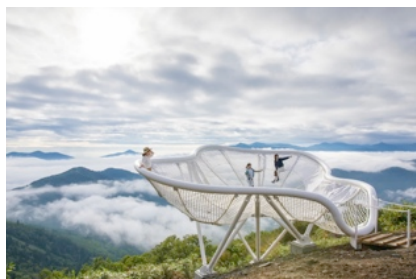
Cloud Pool (クラウドプール)

当リゾートでは絶景を眺められる「雲海テラス」を運営しており、気象条件が整った日には雲海を見ることができます。雲海の鑑賞に加えて雲をテーマにした滞在を楽しみ尽くしてほしいという思いから、2015年7月より雲ガールステイの販売をしてきました。滞在中に雲を見て、食べて、触れる滞在を満喫する女性を、当リゾートでは「雲ガール」と名付けました。客室や食事、アクティビティなど雲にまつわる体験が盛り込まれた2泊3日のプランです。