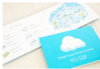
雲海テラス 過ごし方マップ