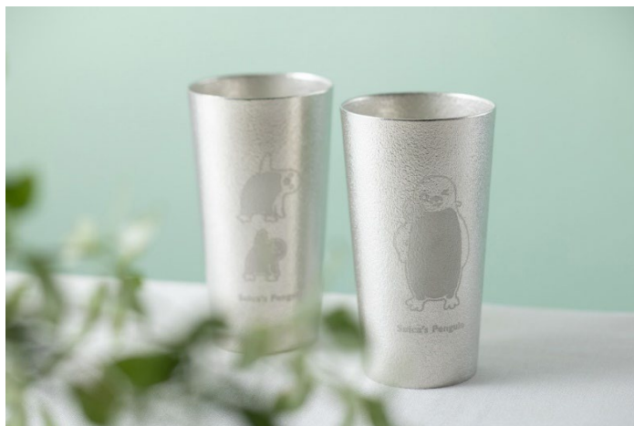
「Suica のペンギン 錫のビアカップ」 左:ヨガ、右:バラ 各11,000円(税込)