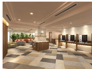
ホテルロビー（イメージ）