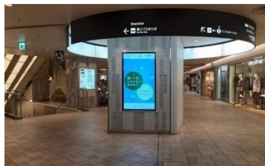
相鉄ジョイナスのサインページ