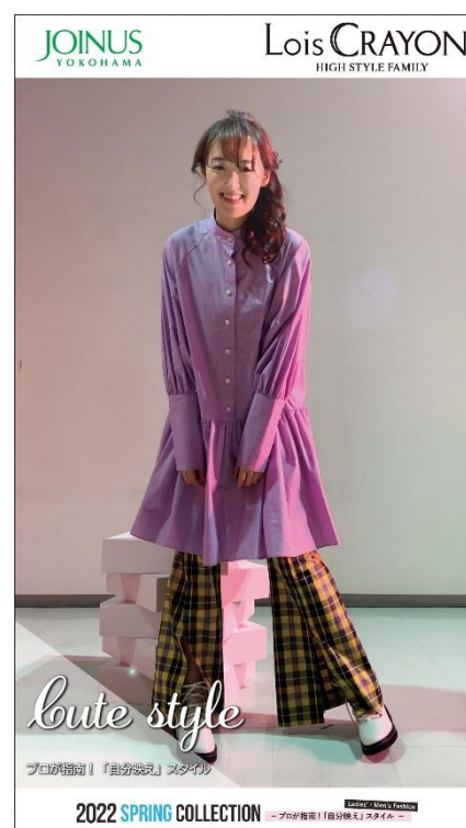
「2022 スプリングコレクション」動画(イメージ)