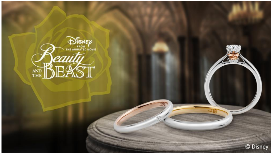
※婚約指輪は、魔法のバラをモチーフにした『The Enchanted Rose』（販売中）

https://www.k-uno.co.jp/disney/princess/