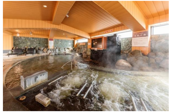
▲スパリゾート雄琴 あがりゃんせ