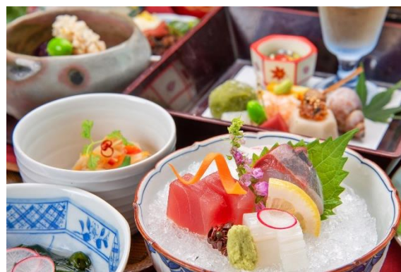
▲天然源泉の宿 ことゆう 夕食