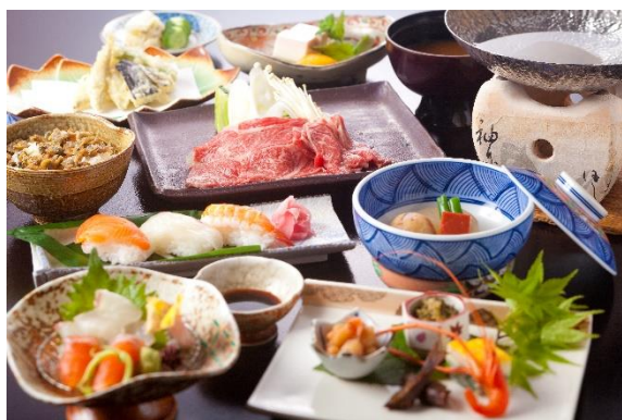
▲暖灯館きくのや 夕食