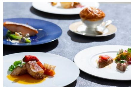
ランチコースイメージ