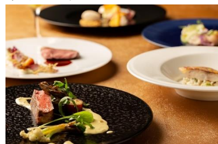
ディナーコースイメージ