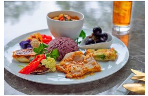
ワンプレートランチ(十六穀米)イメージ