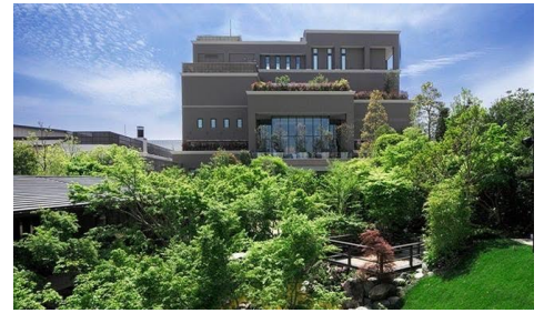
庭園側から見た大宮璃宮