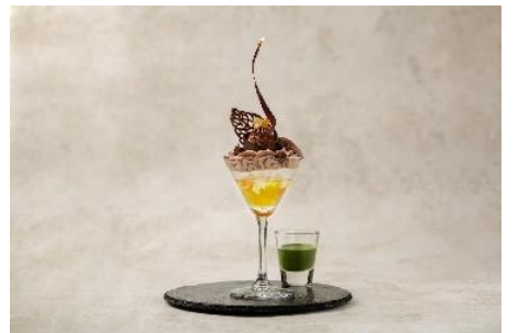
パフェショコライメージ