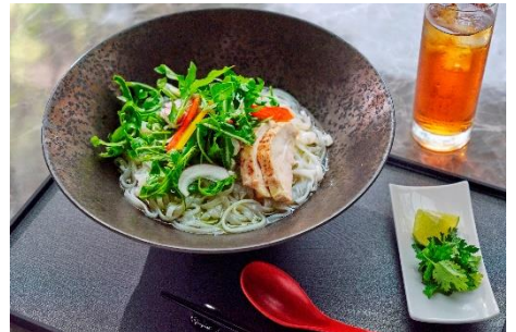
エスニックヌードル(ランチセット)イメージ