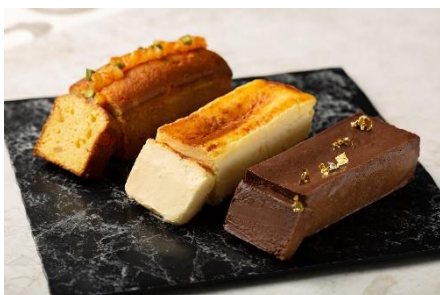
お持ち帰り用パウンドケーキイメージ