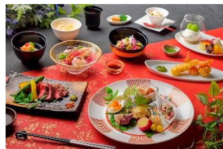
和会食(11,000円)イメージ