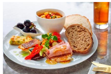
ワンプレートランチイメージ

訪れるたびに新しい発見があり、一緒に過ごすたびに絆が深まる。そんなレストランを目指し、日々の暮らしに寄り添った、思い出に残る食事シーンを演出いたします。