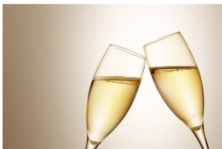
ドリンクイメージ