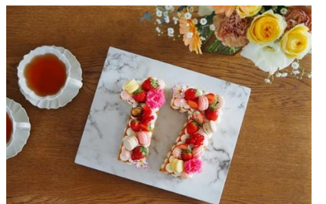
ナンバークーキイメージ