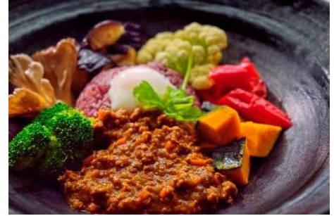
キーマカレーイメージ