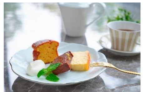
プチパウンドケーキイメージ