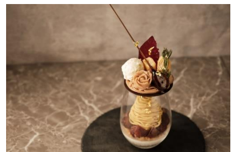
季節のパフェ(モンブランパフェ)イメージ