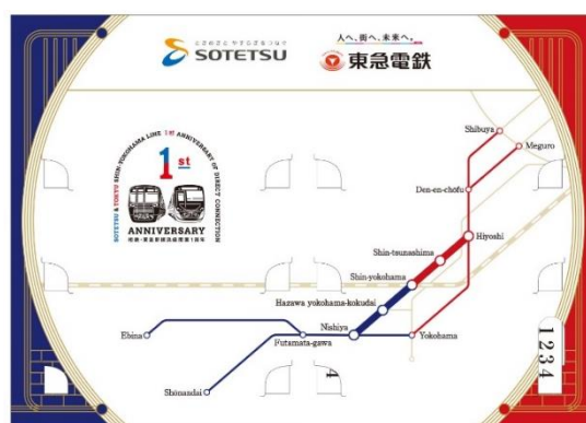
特製の専用台紙の表紙（左）と裏表紙（右）※いずれもイメージ