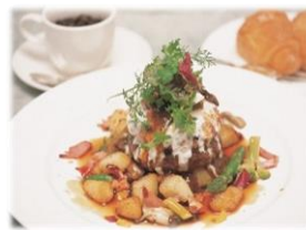
▲大麦牛のハンバーグ 2種のソースラ・ローズ風 ¥2,080 (税込)

なかでも、本格シェフが自然素材にこだわったレストラン「ラ・ローズ」では、大麦牛を使用したハンバーグなどが堪能できます。ローズガーデンのバラと共に、是非お楽しみください。