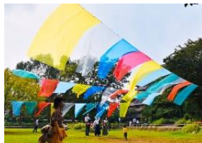
アート体験コーナー

千葉県誕生150周年記念事業総合プロデューサー小林武史氏、総合ディレクター北川フラム氏、熊谷知事によるトークセッション等が行われます。