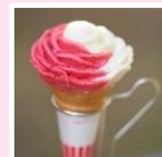
▲赤白バラ盛りジェラート ～バラの花を赤く塗ろうよ～ ※土日祝限定 各日10個