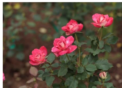
インドの育種家が作出し、御巫さんにちなんで「ブラッシング・ユキ」と命名されたバラ

「里見公園バラ園」には式場病院ゆかりの古い品種のバラがあり、バラ園のデザインもクラシックな感じが魅力のひとつです。「谷津バラ園」は「日本のバラの父」鈴木省三さんが京成電鉄からの依頼でデザインしました。「京成バラ園」は、現在の千葉県のバラ文化を育てたランドマーク的存在と言っても過言ではない、日本を代表するバラ園です。「佐倉草ぶえの丘バラ園」は、バラを見せるだけでなく、品種保存にも力を入れていて、世界的にも評価が高い素晴らしいバラ園です。それぞれのバラ園が見せてくれる、バラの違った表情や魅力を楽しみながら「ちばローズ・ガーデン・ロード」を巡るのがおすすめです。