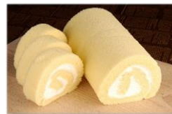
▲人気の谷津ロール

行列ができるほどの有名店！ふわふわのスポンジに生クリームをサンドして、巻きあげた「谷津ロール」や「岩シュー」が人気。 営業時間：10:00～18:30 定休日：火曜日・水曜日