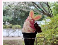
▲カフェ パティオ 「白うさぎのバラのミックスソフト」

園内の「カフェ パティオ」やキッチンカーの「da Luciano (ダルーチアーノ)」でも、期間限定のコラボメニューが楽しめます。是非ご賞味ください！