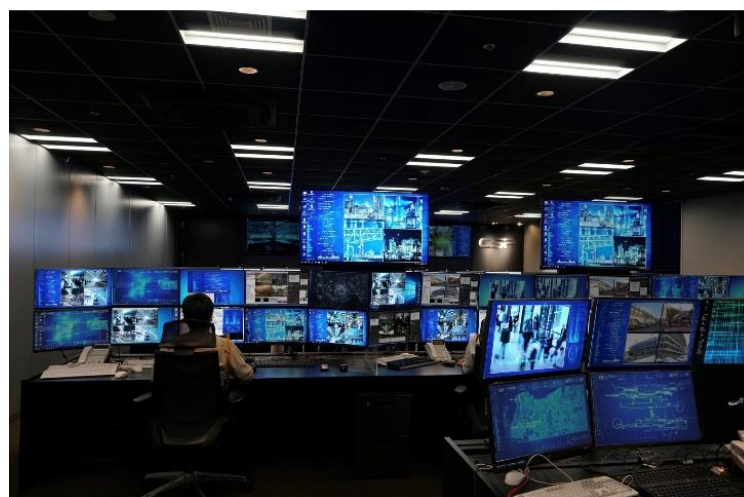
セントラル警備保障 画像センター