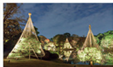
大徳園「大名庭園と紅葉のライトアップ」