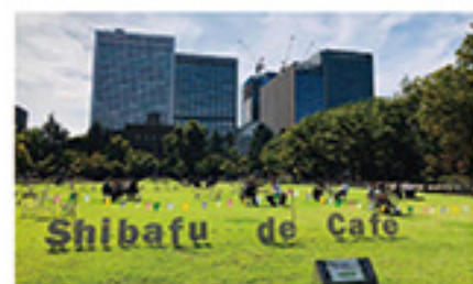
日比谷公園「Shibafu de Cafe」

様々なニーズに応える新しい発想や先端技術を積極的に取り入れ、公園が潜在的にもつ多面的な機能を発揮させます。また、公園と地域との交流や連携を深め、新たな賑わいの創出と魅力向上に貢献します。さらに、大規模災害に備え、実践的な訓練や普及啓発に取り組み、地域とともに災害対応力の向上を図ります。