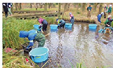
都立公園におけるかいぼり

東京の緑と水について、その歴史や魅力、大切さを、出版物や講座、ガーデニングショーなど様々な媒体で広く伝えます。また、都立公園でのボランティア活動の支援や、東京都都市緑化基金による地域の緑化活動の支援を通じ、花と緑の豊かなまちを支える活動や人材育成に貢献します。さらに、生物多様性に配慮した管理や普及啓発により、かけがえのない生態系を守り育てます。