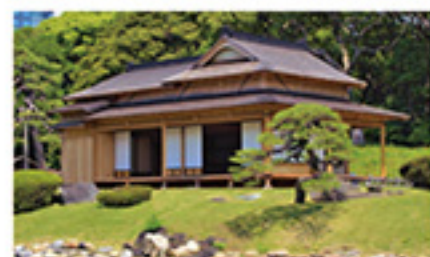
浜離宮恩賜庭園「松の御茶屋」

確かな知識と技術力により作庭意図を踏まえた維持管理を行います。さらに、本物の庭園を「見る」「知る」「体験する」という視点で質の高いサービスを提供し、文化財庭園としての価値向上と利活用の調和を図り、未来に継承します。