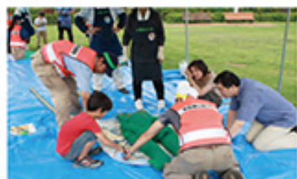
府中の森公園 地域と連携した防災訓練