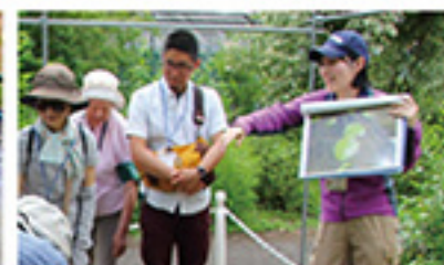
神代植物公園植物多様性センター ガイドツアー