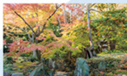
日古河庭園 紅葉期の日本庭園