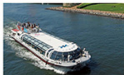
水上バス「東京水辺ライン」