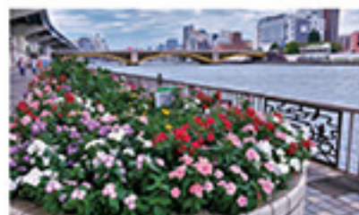
隅田川テラス 花守さん花壇

隅田川等の水辺の魅力を幅広く情報発信するとともに、地域や企業等と連携したイベントの実施などを通じて水辺空間の賑わいを創出しています。また、隅田川や荒川、臨海部などで水上バスを運航し、東京の水辺における魅力的な船旅を提供するとともに、発災時には防災船として傷病者や救援隊、救援物資等の輸送を担えるよう防災訓練を実施しています。加えて、調節池や隅田川テラス等の河川管理施設の維持管理、河川工事監督補助等の河川事業支援などを通して、都民生活の安全・安心の確保に努めています。