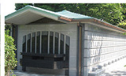
谷中霊園(立体埋葬墓地)