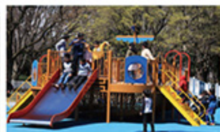
祐公園「みんなのひろば」