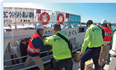
水上バスを活用した防災訓練