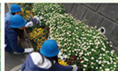
地域の緑化活動支援