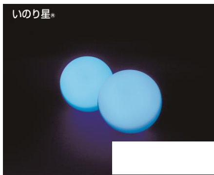
「いのり星®」イメージ