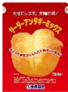
沖縄製粉 サターアんだギーミックス 本体価格 3 5 8 円 (税込価格 3 8 6 . 6 4 円)