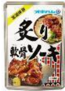
沖縄ハム総合食品 炙り軟骨ソーキ 本体価格 4 0 0 円 (税込価格 4 3 2 円)