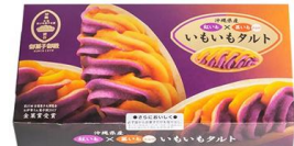
御菓子御殿 いもいもタルト 本体価格 8 0 0 円 (税込価格 8 6 4 円)