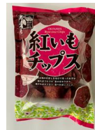
オキコ 紅いもチップス 本体価格 3 0 0 円 (税込価格 3 2 4 円)