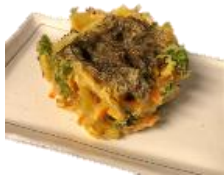
彩り野菜と 沖縄県産もずくのかき揚げ 本体価格 1 2 8 円 (税込価格 1 3 8 . 2 4 円)