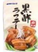
沖縄ハム総合食品 黒酢ラフテー 本体価格 4 8 0 円 (税込価格 5 1 8 . 4 0 円)