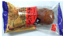
沖縄南風堂 黒糖あんだぎー 本体価格 1 0 0 円 (税込価格 1 0 8 円)