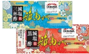
トリトンフーズ 雅もずく(減塩黒酢・減塩三杯酢) 本体価格 1 9 8 円 (税込価格 2 1 3 . 8 4 円)