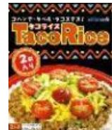
沖縄ハム総合食品 タコライス (S) 2 食入り 本体価格 4 5 0 円 (税込価格 4 8 6 円)