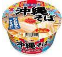
明星食品 沖縄そば カップ 本体価格 1 2 8 円 (税込価格 1 3 8 . 2 4 円)