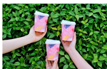
※写真は全てイメージ