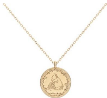
Based on the "Winnie the Pooh" works by A.A. Milne and E.H. Shepard.