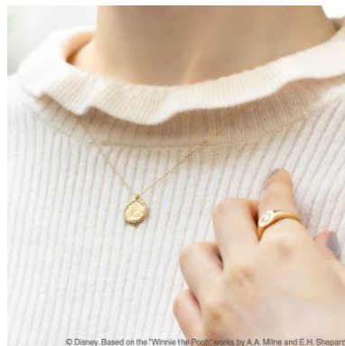
Based on the "Winnie the Pooh" works by A.A. Milne and E.H. Shepard.