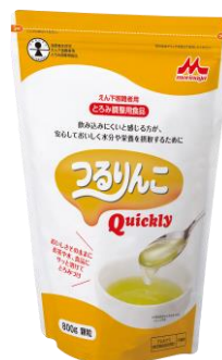
800g (スタンディング袋)