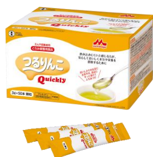
3g×50 本 (スティック)

食べる方(のえん下機能)によって、適切なとりみの強さが異なります。医師・歯科医師・管理栄養士・薬剤師・言語聴覚士等のご指導に従って使用してください。