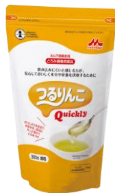
300g (スタンディング袋)