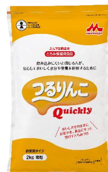
2 kg (アルミ袋)