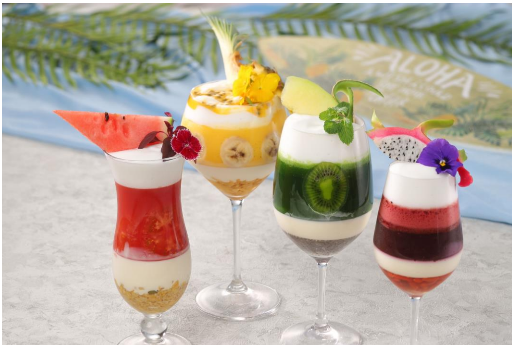
スムージーメニュー(イメージ)

ゆったりした店内で、楽しいカフェタイムをお過ごしいただけるよう皆さまのご利用をお待ちしております。