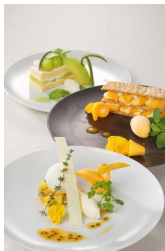
ケーキメニュー(イメージ)