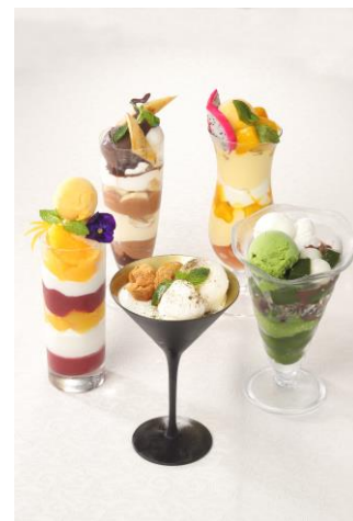
パフェメニュー(イメージ)