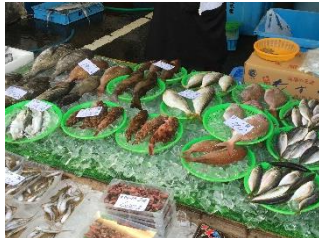
新鮮な魚介や野菜の販売(イメージ)

大阪湾で水揚げされた新鮮な魚介類や収穫されたばかりの野菜などを販売。また、店長おすすめの一品が登場します。