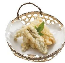
名物 アナゴの天ぷら