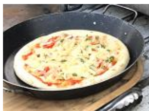
クワトロフォルマッジ