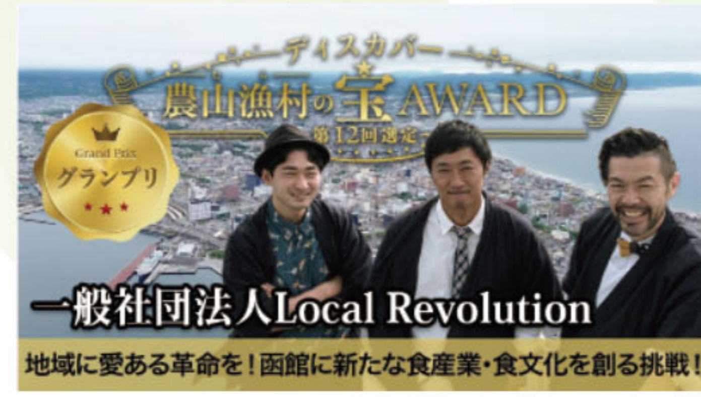
取組紹介のPR動画 (グランプリ地区)