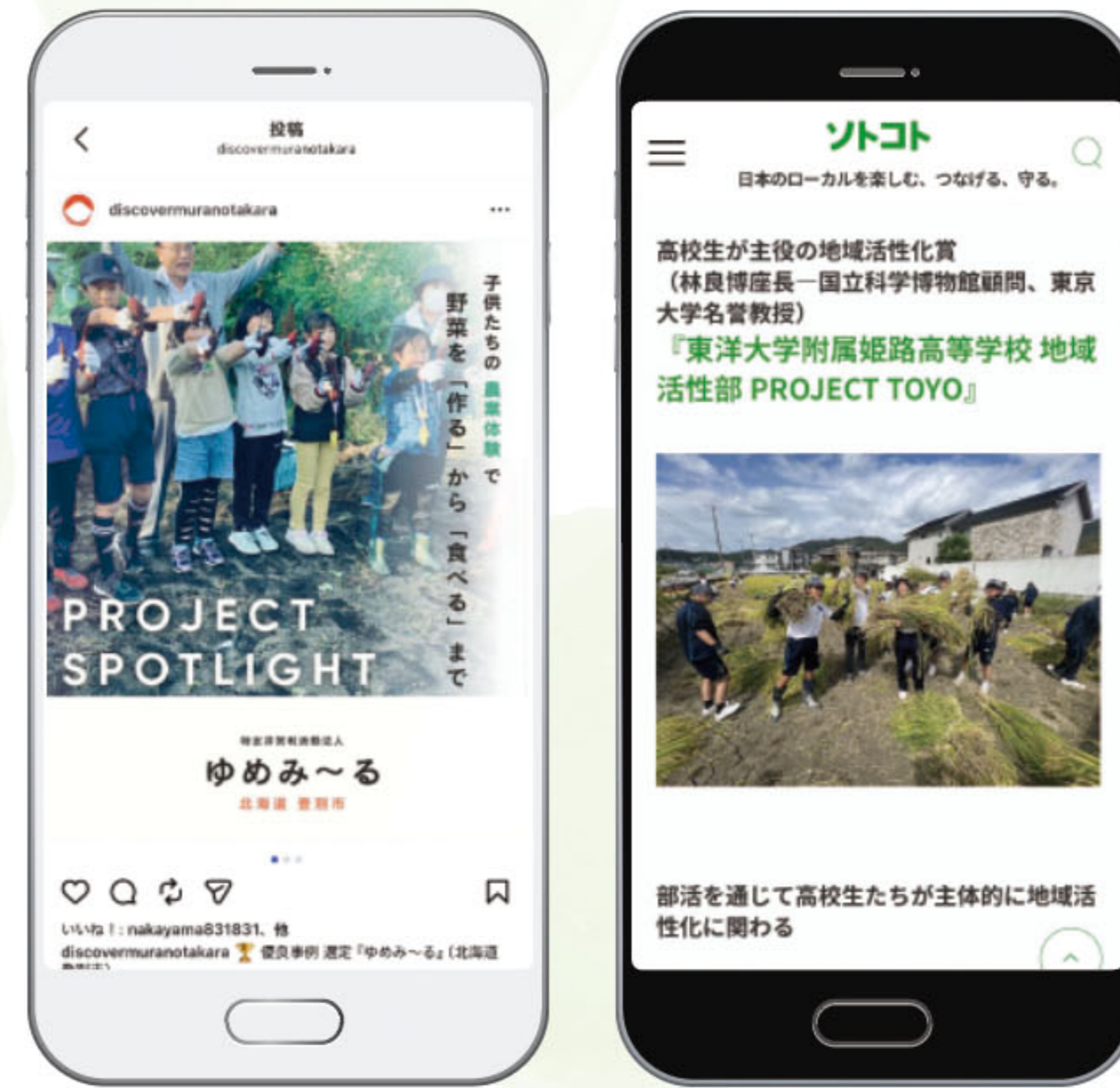
メディア媒体 (インスタ、ソトコ) での記事掲載