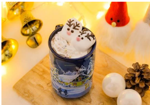
トナカイのホットチョコレート

また、12月24日(木)、25日(金)にはサンタクロースが登場し、人数限定で撮影会を実施します。クリスマスにしか体験できないスペシャルイベントで、大切な人といつまでも思い出に残る特別な1日をお過ごしください。