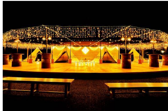
プライベートシート