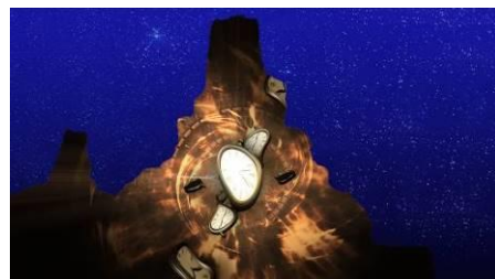
↑時空の歪みが発生したノームアイランド

マジカルラグーンを舞台に、プロジェクションマッピングの映像とダンサーによるショーが新登場。マジカルラグーンに浮かぶ「ノームアイランド」に突如出現した“時空の歪み”をテーマに、2人の主人公が皆さまを魅了します。