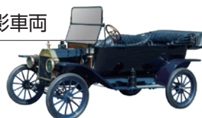
フォード モデルT ツーリング (1914/米)