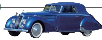
ランチア アストウラ ティポ 233C (1936/伊)