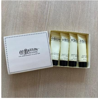
特典のスキンケアセット