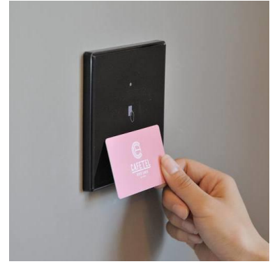
オートロックなのでセキュリティも安心