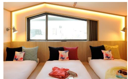
※写真は全てイメージです。