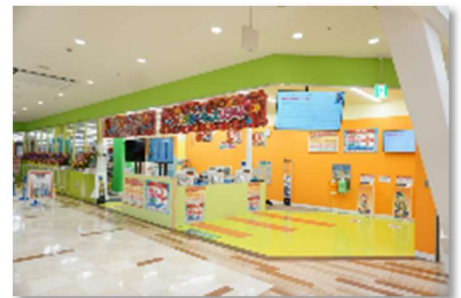
※写真は2018年12月にオープンした船橋店入口の様子

名称： ファンタジーキッズリゾート多摩 場所： 〒206-0033 東京都多摩市落合 2-33 クロスガーデン多摩 2階 オープン： 2019年4月下旬(予定) 施設面積： 約1,144坪 管理運営： ファンタジーリゾート株式会社 URL： http://www.fantasyresort.jp/