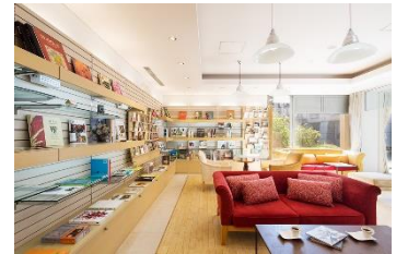
ロテルド比叡 ライブラリー