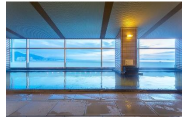
琵琶湖ホテル るりの湯