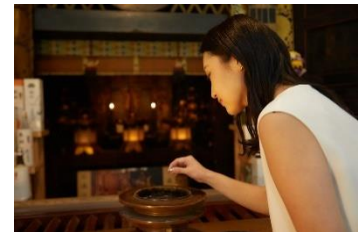
延暦寺 朝のお勤め体験イメージ