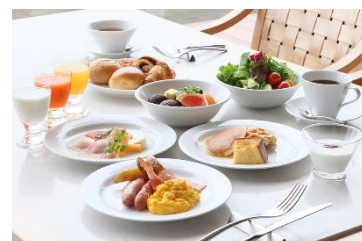
琵琶湖ホテル 朝食イメージ