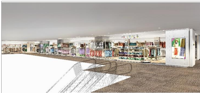
※<#ワークマン女子>売り場イメージ

いよいよ、2022年10月14日(金)に5階を「生活アップデートフロア」としてリニューアルオープンし、改装が完成します。