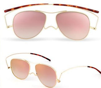
フレームカラー ラスターゴールド