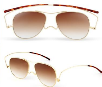
フレームカラー ラスターゴールド