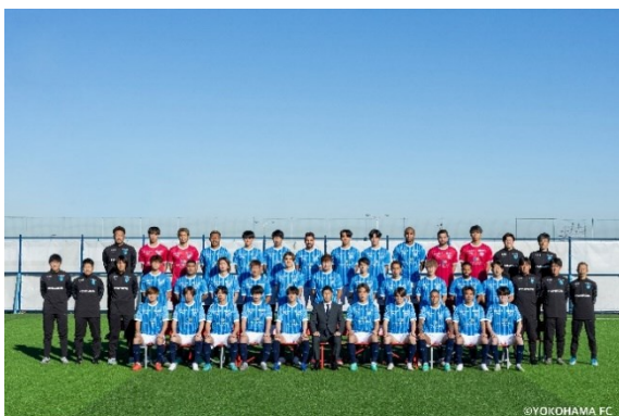
協定を締結した横浜FC