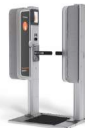
ICチップを読み込むゲート