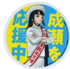
ステッカーイメージ

◇お問合せ：琵琶湖汽船予約センター TEL077-524-5000（9:00～17:00）